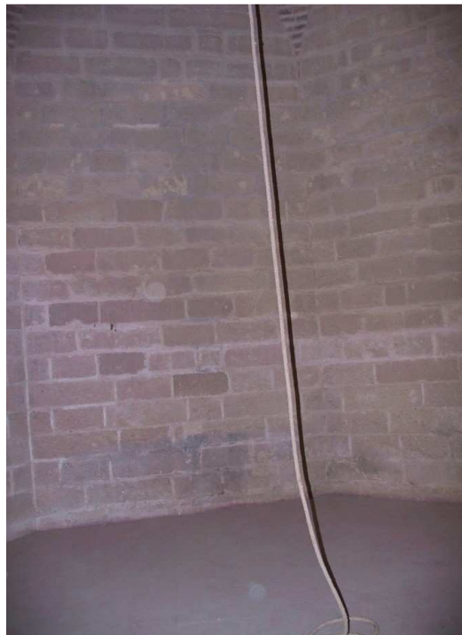
Interior de la mazmorra de la torre del Homenaje. Los sillares, en perfecto estado de conservación, son los originales del siglo XIV.