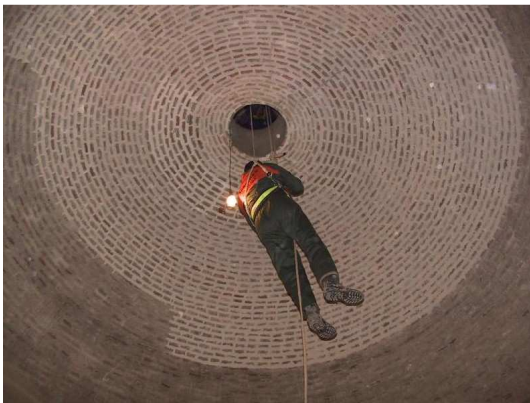
Intradós de la bóveda de la mazmorra de la torre del Homenaje. Puede verse el estrecho agujero por el que se accede, el resanado de parte de la bóveda y la imposibilidad de salir sin ayuda exterior.