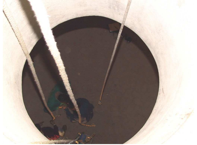
Entrada a la mazmorra. El suelo se halla a 8 m. en caída libre. Su único acceso es el círculo de la fotografía.