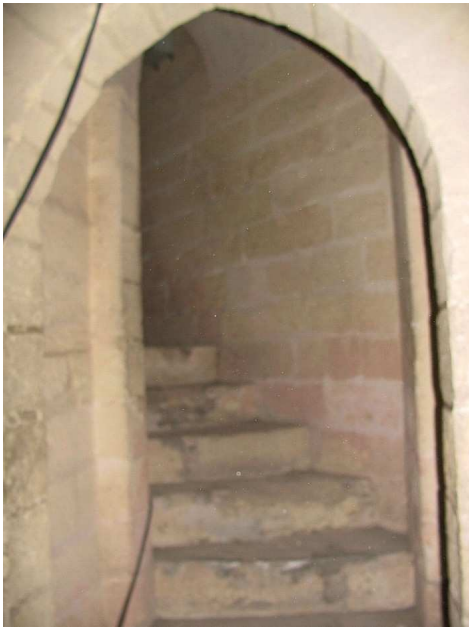
Escalera de bajada al cuerpo de guardia de la torre del Homenaje. Debajo se encuentra la mazmorra.